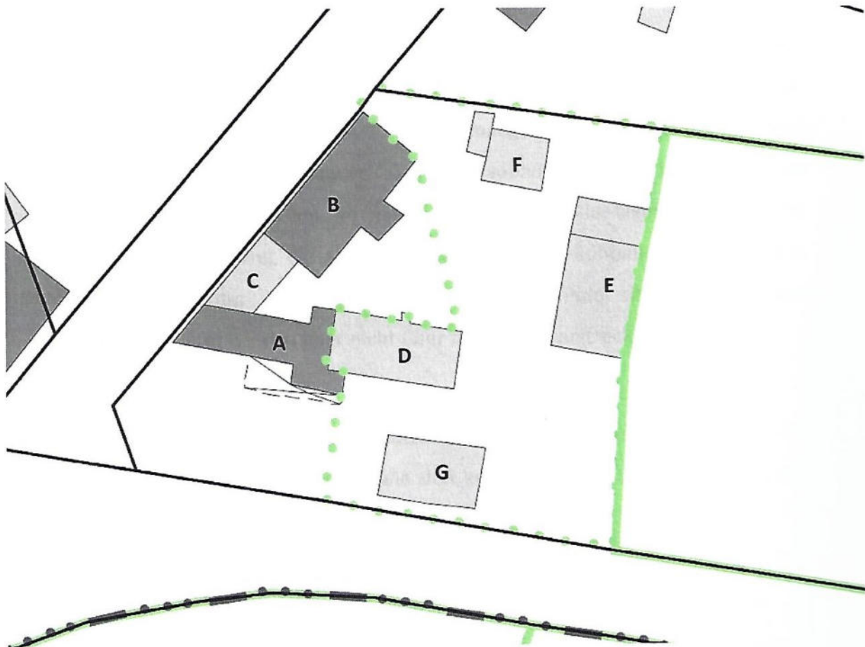
Abbildung 5: vergrößerter Ausschnitt der Liegenschaftskarte mit Bodenschätzung Übersichtsskizze der Hofstelle mit Gebäudebezeichnungen